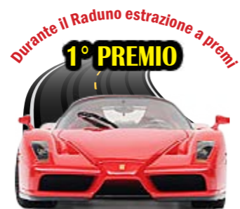
un giro al volante di una Ferrari